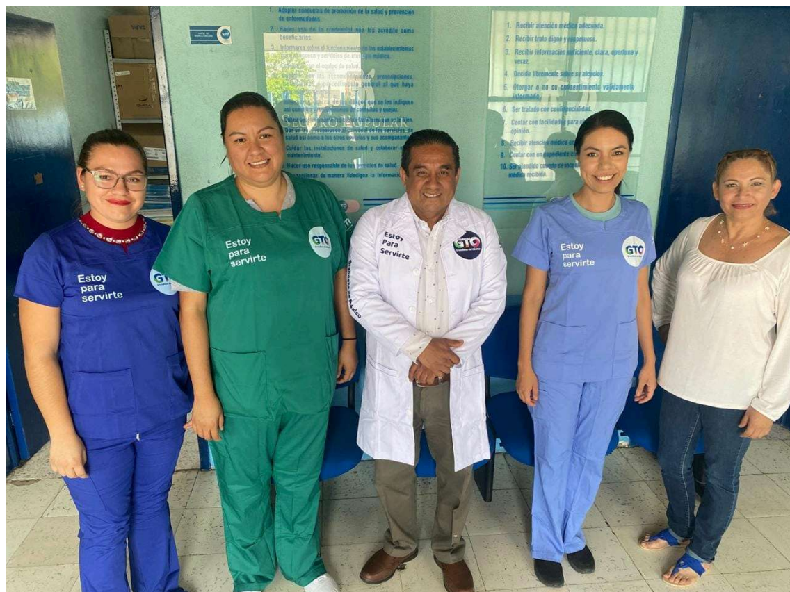
UMAPS Tarimoro comienza la entrega de uniformes para las y los profesionales de la salud. Con este uniforme, llevan consigo el símbolo de pertenencia al Mejor Instituto de Salud Pública de México.