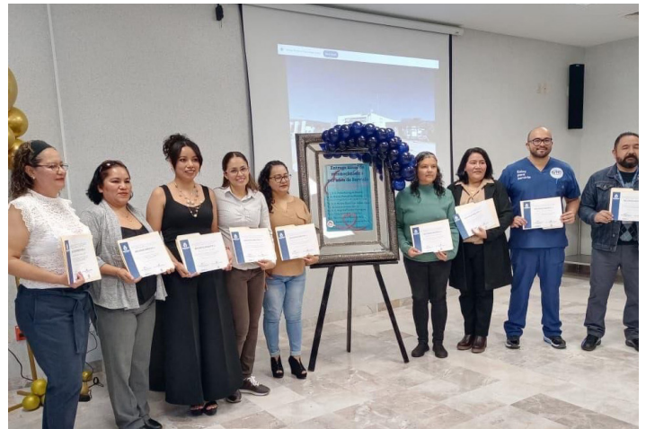
Hospital Comunitario de Comonfort