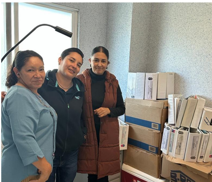
Hospital Comunitario Yuriria