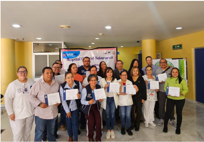
Hospital General de Salamanca