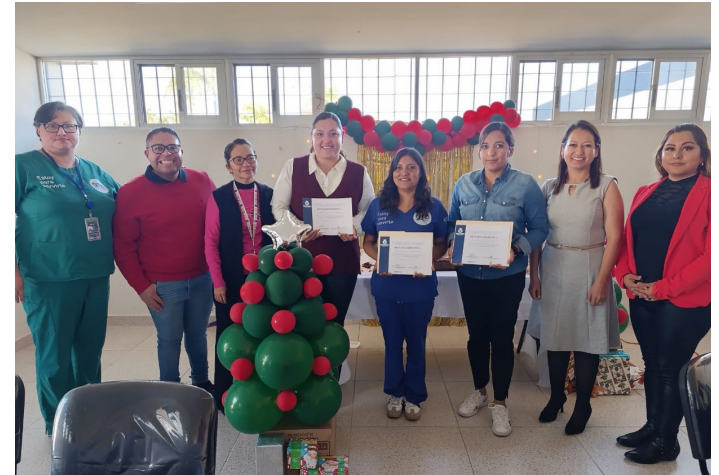
Centro de Atención Integral de Adicciones (CAIA)