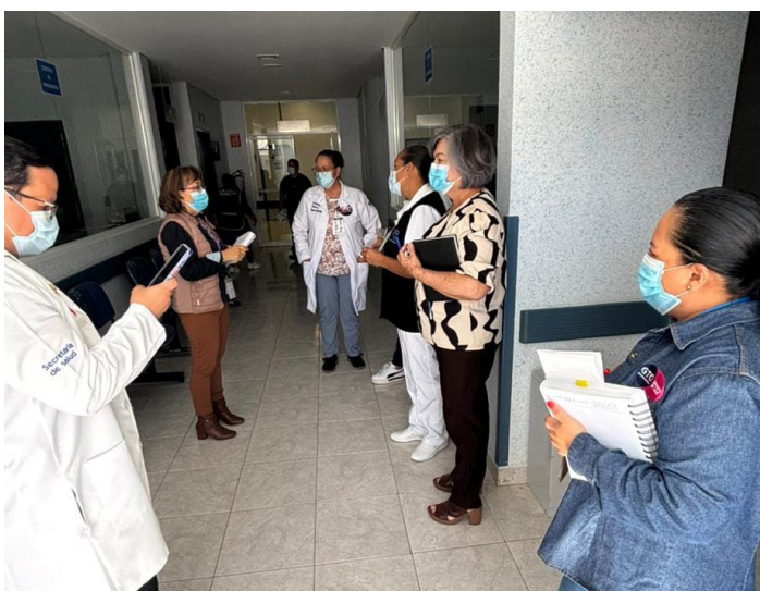
Hospital Comunitario Santa Cruz de Juventino Rosas

“Gestiones encaminadas para contar con las condiciones adecuadas en los Centros de Trabajo, Tecnología de punta y Materiales, mantener una relación laboral equilibrada a través de la aplicación de las Condiciones General del Trabajo y acuerdos estatales en beneficio de las y los trabajadores.”