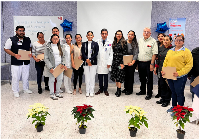
Hospital General San Miguel de Allende