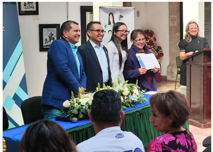
Jurisdicción Sanitaria VI