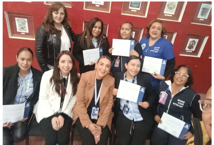
CAISES San Diego de la Unión