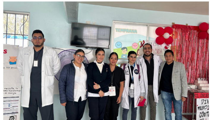
CAISES Emiliano Zapata