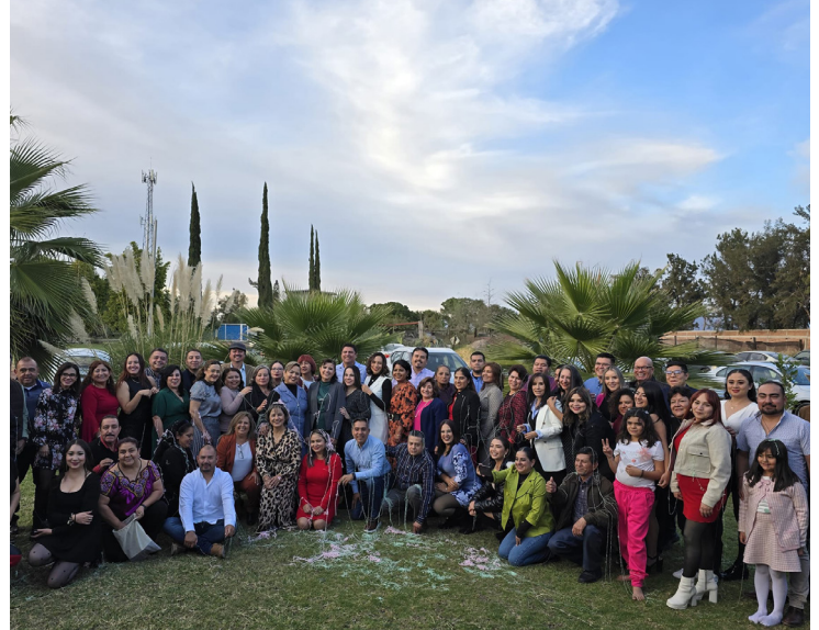
Jurisdicción Sanitaria V

En un ambiente de cordialidad y compañerismo, los profesionales de la salud celebraron sus logros en convivios especiales. Este tipo de eventos son una excelente oportunidad para reconocer la dedicación y el esfuerzo de cada miembro del equipo, quienes día a día trabajan arduamente para brindar una atención de calidad a la población. Al compartir experiencias y celebrar en conjunto, se fortalece el sentido de pertenencia y se motiva a los profesionales a seguir dando lo mejor de sí mismos.