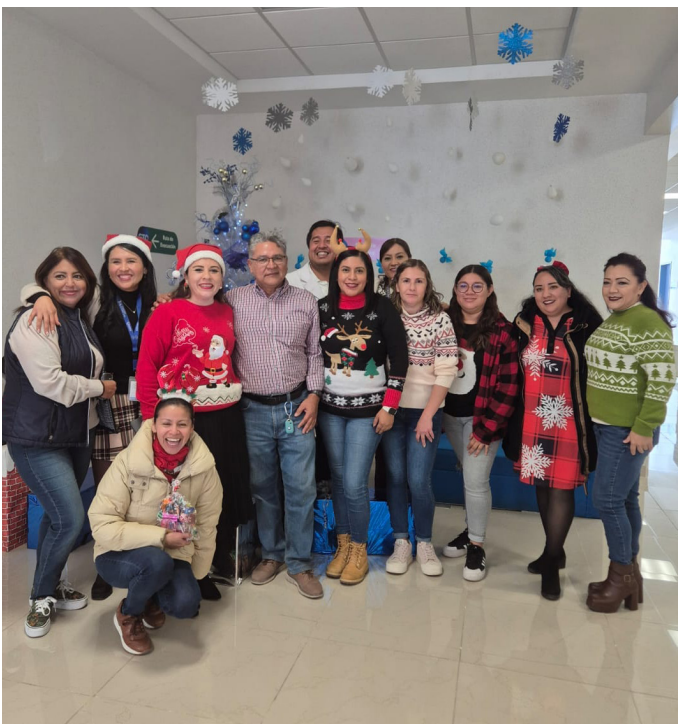
CAISES Apaseo El Grande