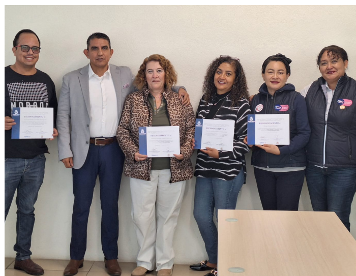
Cabecera Jurisdiccional VI