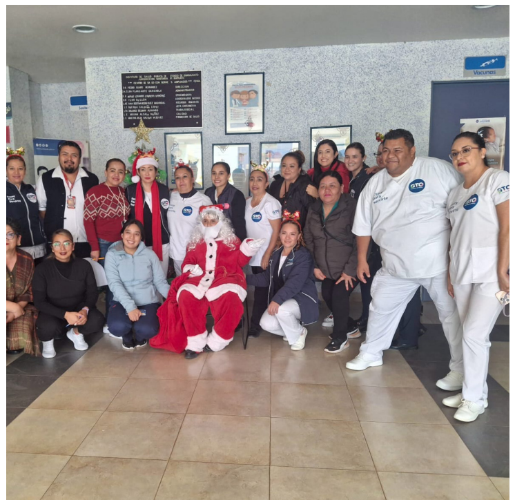
CESSA Santa Ana