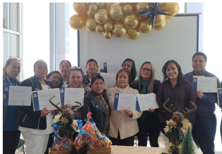
Sector III de la Jurisdicción Sanitaria VII